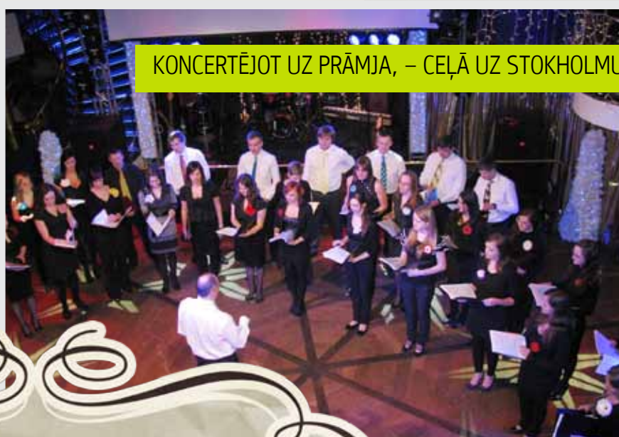
KONCERTĒJOT UZ PRĀMJA, – CEĻĀ UZ STOKHOLMU