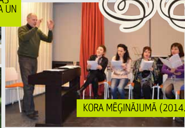
KORA MĒĢINĀJUMĀ (2014. G.)