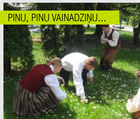
PINU, PINU VAINADZIŅU...