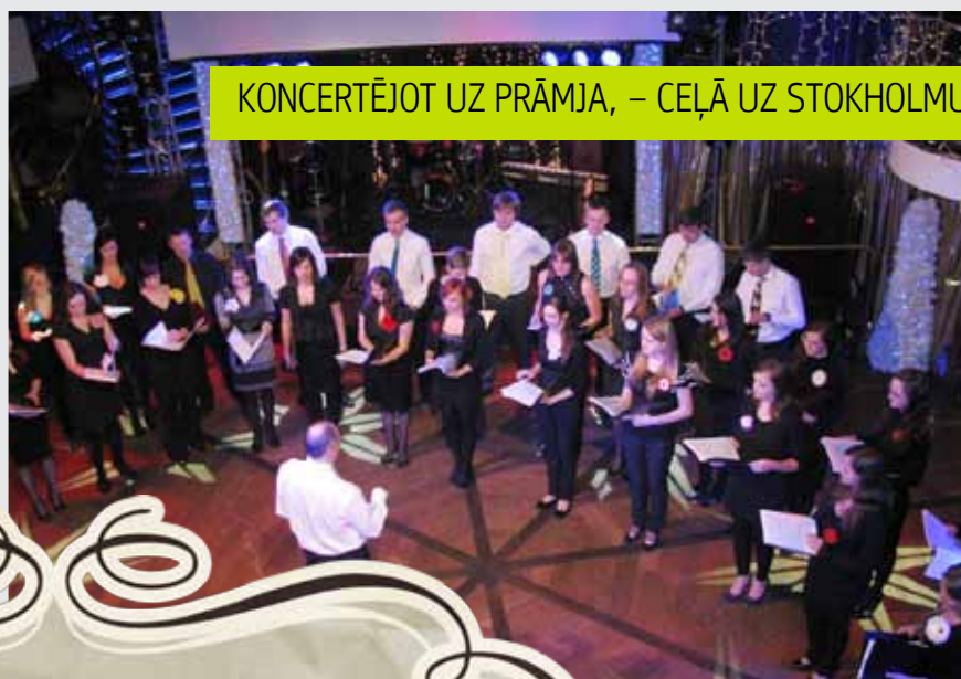
KONCERTĒJOT UZ PRĀMJA, – CEĻĀ UZ STOKHOLMU