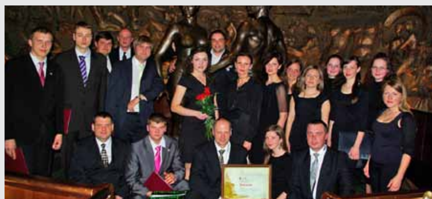
KORIS „SONITUM” – KONKURSA „KRISTĀLA KAPELA” LAUREĀTI – MASKAVAS IZSTĀŽU ZĀLĒ „ЯБЛОКО” (2012. G.)