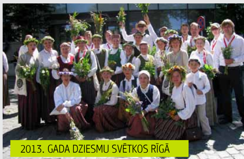
2013. GADA DZIESMU SVĒTKOS RĪGĀ