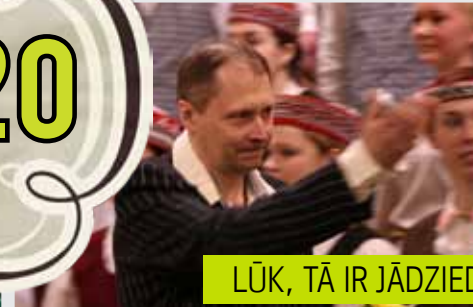
LŪK, TĀ IR JĀDZIED!