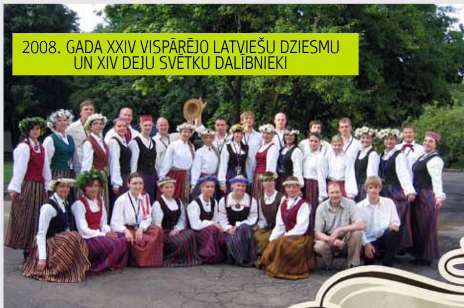
2008. GADA XXIV VISPĀRĒJO LATVIEŠU DZIESMU UN XIV DEJU SVĒTKU DALĪBNIEKI