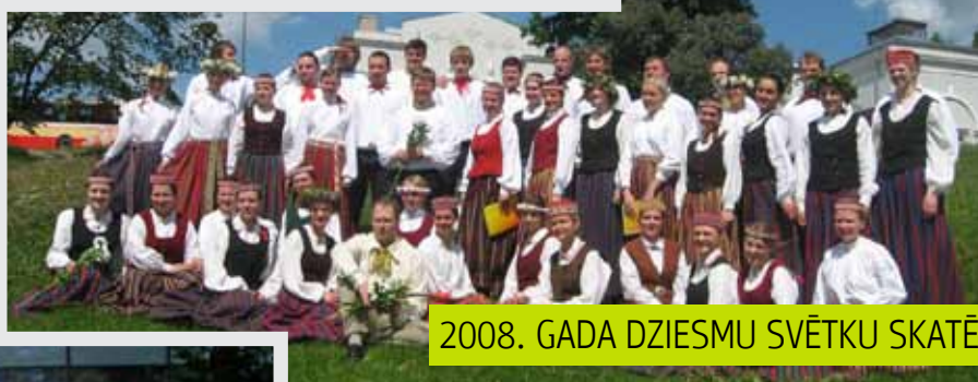
2008. GADA DZIESMU SVĒTKU SKATĒ RĒZEKNĒ