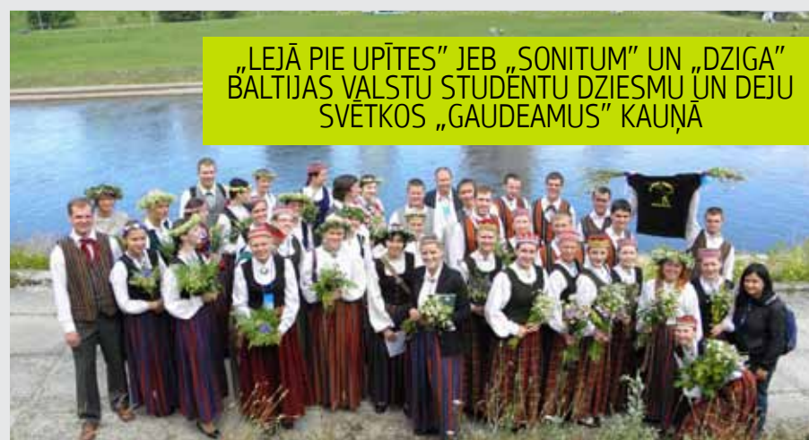
„LEJĀ PIE UPĪTES” JEB „SONITUM” UN „DZIGA” BĀLTIJAS VALSTU STUDĒNTU DZIESMU UN DEJU SVĒTKOS „GAUDEAMUS” KAUŅĀ