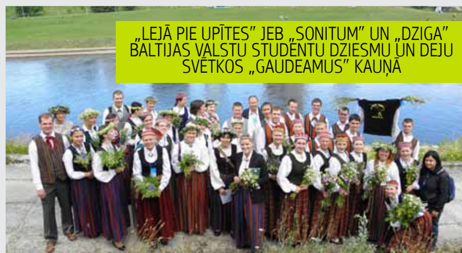
„LEJĀ PIE UPĪTES” JEB „SONITUM” UN „DZIGA” BĀLTIJAS VALSTU STUDĒNTU DZIESMU UN DEJU SVĒTKOS „GAUDEAMUS” KAUŅĀ