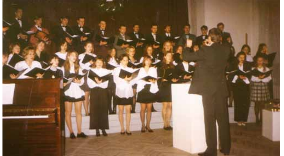
Viena no pirmajām kora uzstāšanās reizēm augstskolā