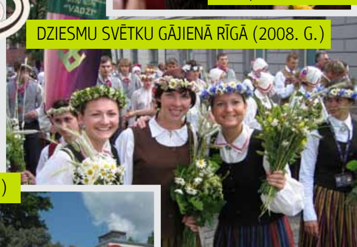
DZIESMU SVĒTKU GĀJIENĀ RĪGĀ (2008. G.)