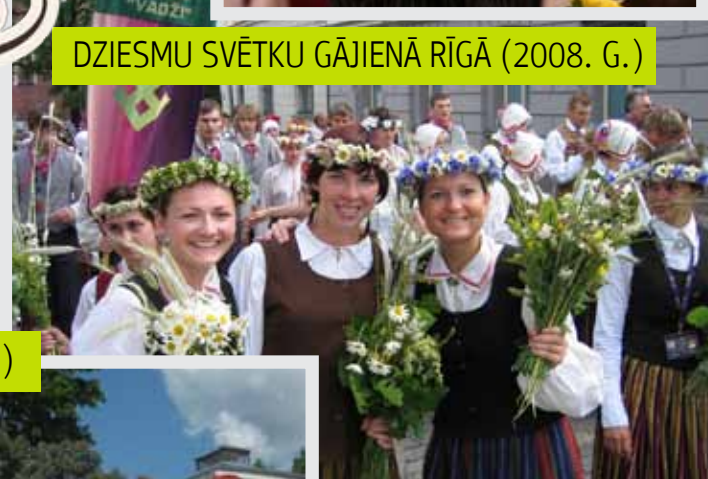
DZIESMU SVĒTKU GĀJIENĀ RĪGĀ (2008. G.)