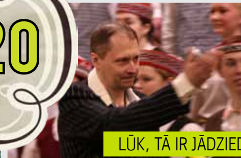
LŪK, TĀ IR JĀDZIED!