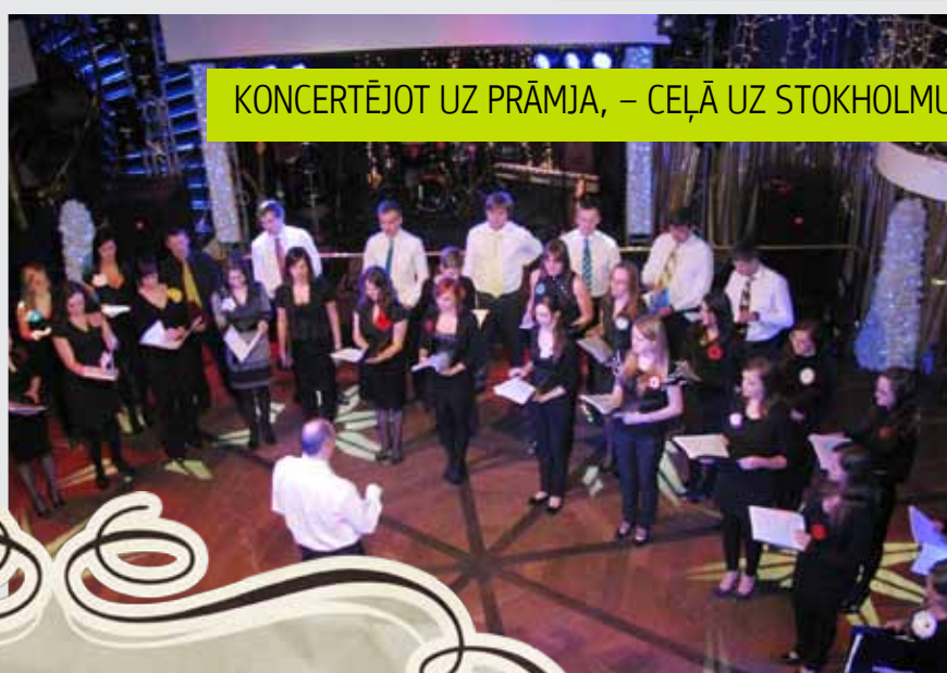
KONCERTĒJOT UZ PRĀMJA, – CEĻĀ UZ STOKHOLMU